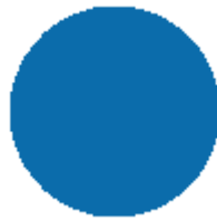
蓝色 lán se