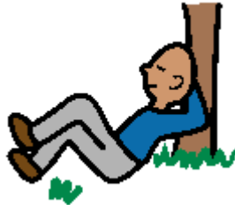
懒洋洋 lǎn yáng yáng