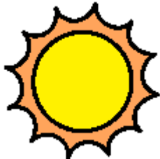
晴朗 qíng lǎng