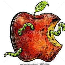
腐烂 fǔ làn