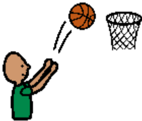
篮球 lán qiú